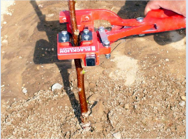
Resim 2: Makas görüldüğü gibi V kısmı fidanın gövde tarafına gelecek şekilde yerleştirilir. Bu işlemde sürgünün merkezleme kanalına yerleşmesine özen gösterilerek kesim yapılır.