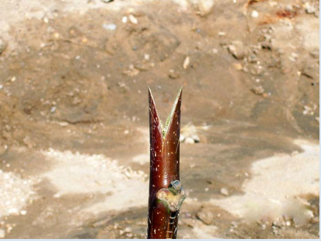
Resim 3: Fidan kesilerek aşıya hazırlanmış durumda