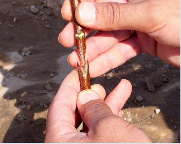
Resim 5: Kesilen kalem fidana yerleştirilir.

Ceviz, üzüm gibi ağlayan türlerde bu kesimin tam tersi yani anaç erkek, aşı kalemi dişi olarak yapılması önerilir.