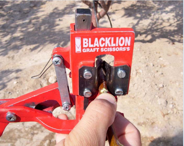
Resim 4: Fidanla aynı kalınlıkta ki aşı kalemi makasın merkezleme kanalına görüldüğü gibi yerleştirilerek kesilir.