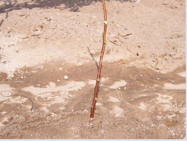
Resim 1: Aşılacak olan fidan (Bu bir dal veya yetişkin ağaçların bir sürgünü olabilir).