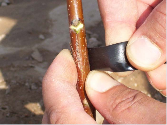
Resim 6: Aşı, kesilen bölgenin 1cm. kadar dışından sıkı bir şekilde izole bantla sarılır.

Ceviz, üzüm gibi ağlayan türlerde bu kesimin tam tersi yani anaç erkek, aşı kalemi dişi olarak yapılması önerilir.